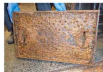
4.蓋の裏も油で汚染。