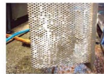
9.発泡して洗浄、浄化