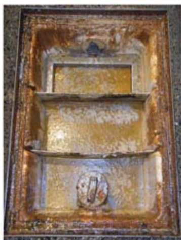
1.グリーストラップの蓋を取ったところ。