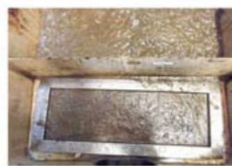
6.油が分解して発泡。