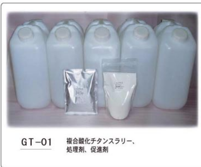
GT-01 複合酸化チタンスラリー、 処理剤、促進剤

油などで汚れたレストランのグリーストラップにGT-01を加えると、直ぐに油汚れが二酸化炭素などに分解されて急激に発泡し始めます。それと同時に、茶色の油汚れが白くなって急速に悪臭が消えます。そして、グリーストラップの縁などを軽くこすると簡単に汚れが取れ、グリーストラップの周りの汚れなどもきれいに取れて抗菌効果も得られます。