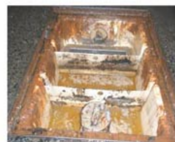
2.油が酸化して茶褐色に変化。