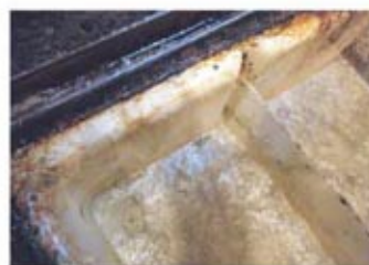
7.油汚れが除去された。